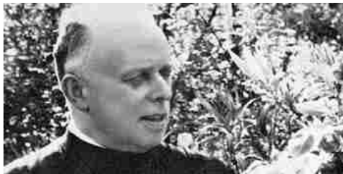
Don Primo Mazzolari

f Share Consiglia Condividi 4 persone consigliano Tweet